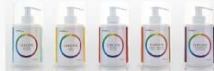
Cromoemulsiones incluidas con el RFZONE

RFZONE dispone de protocolos preestablecidos para el tratamiento corporal y facial, así como la posibilidad de programa libre.